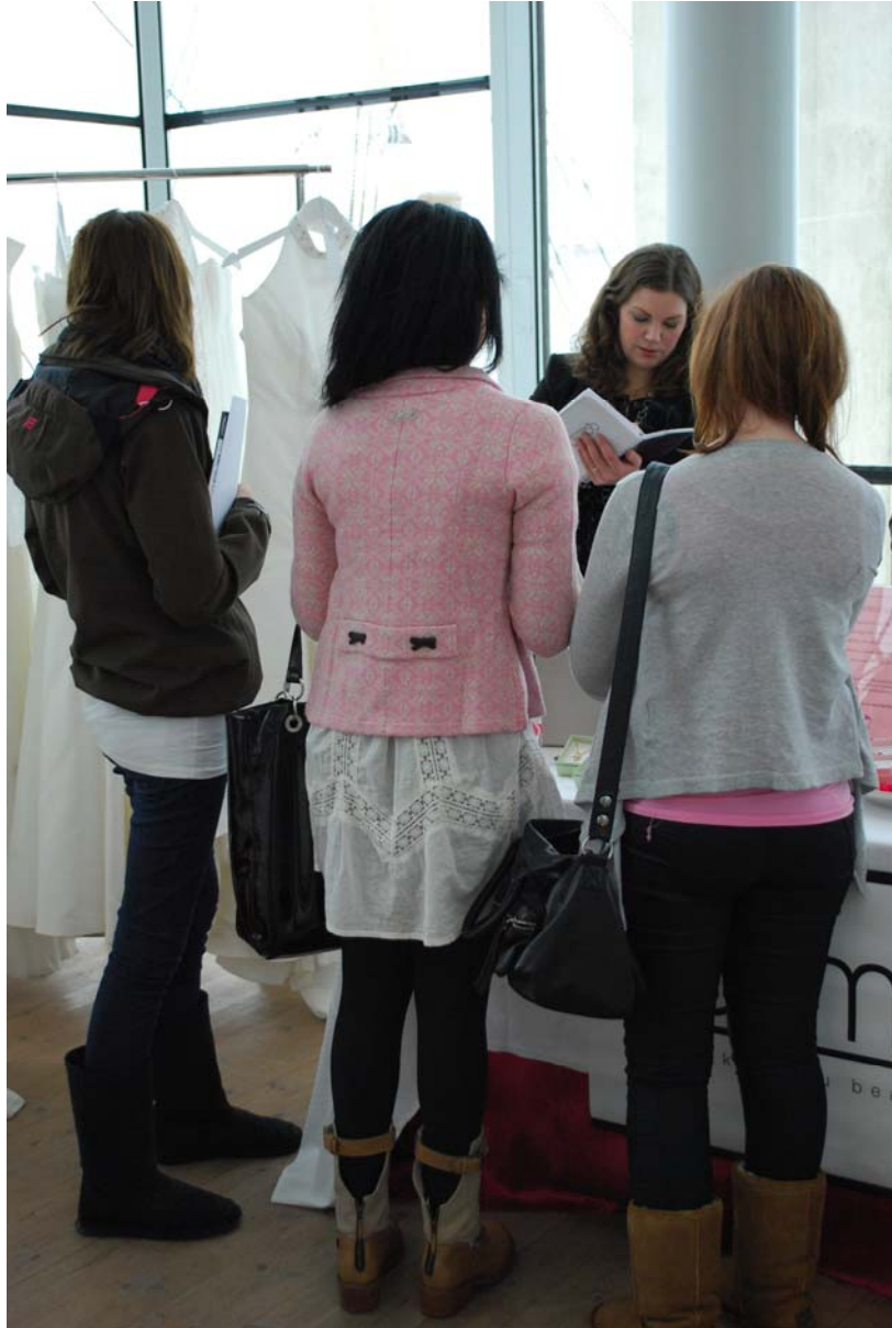
Qarmas monter (återförsäljare i Karlskrona) var välbesökt under mässan.